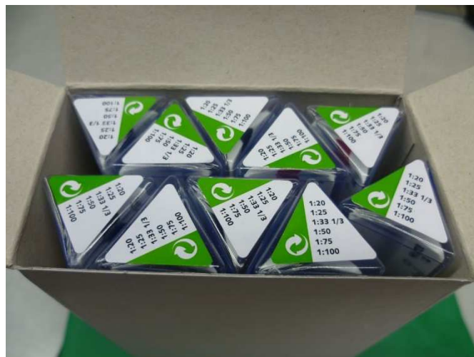
Kennzeichnung der Köcher